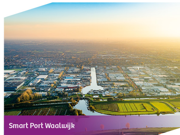
Smart Port Waalwijk