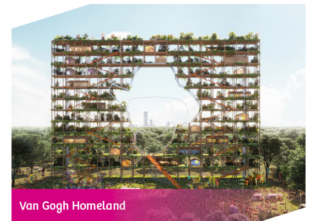
Van Gogh Homeland