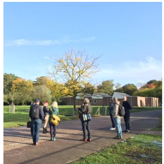
Rondleiding op Landpark Assisië (Prisma)