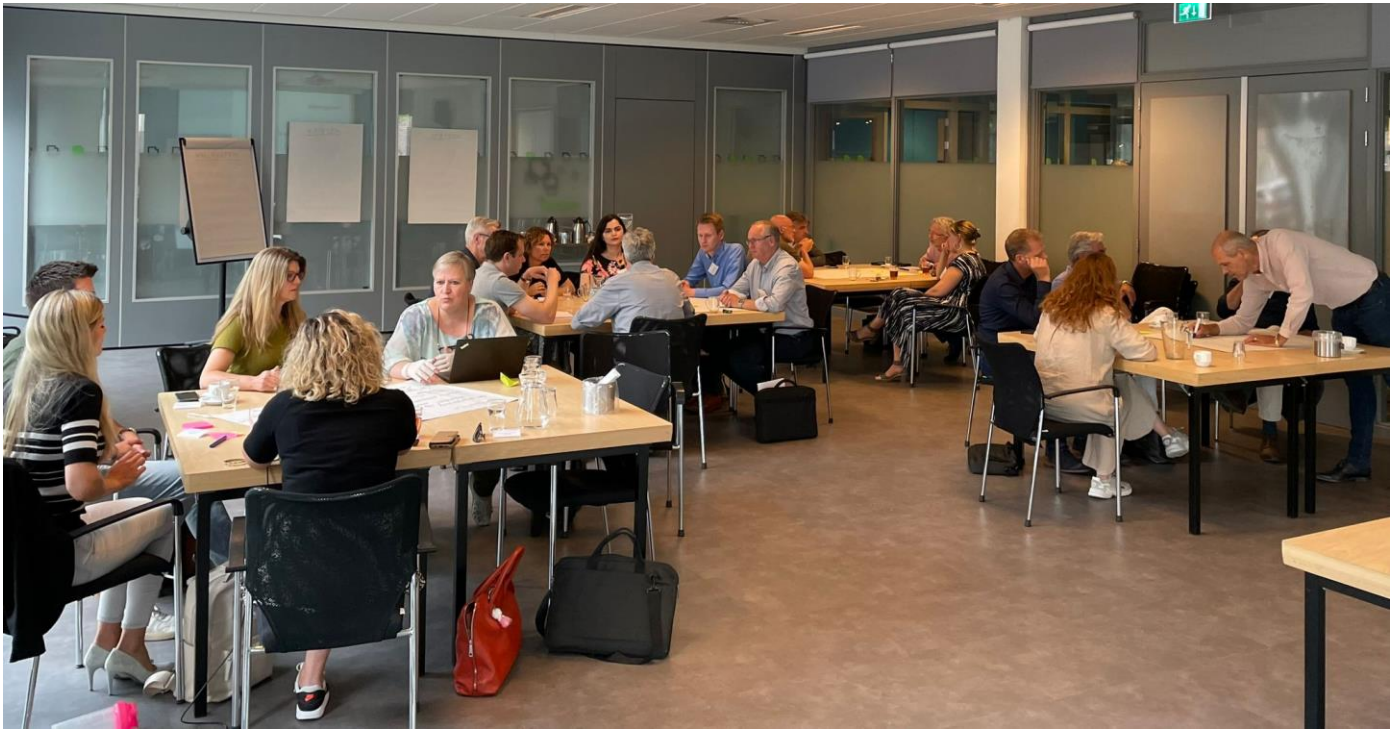
Verduurzaming gehoord vastgoed