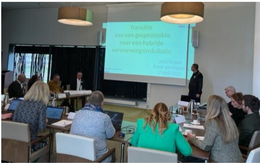
Uitleg transitie installaties (Het Laar)