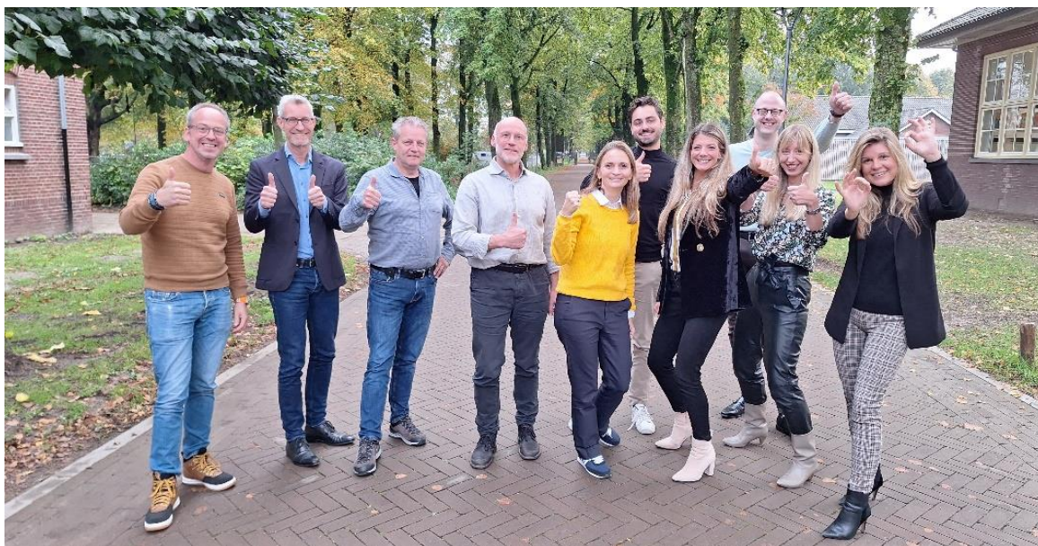
Laatste bijeenkomst Kennisgroep Green Deal Zorg 2.0 (enkele deelnemers ontbreken op de foto)