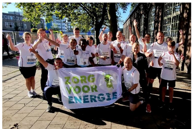
Foto: Team Amarant tijdens de Tilburg Ten Miles.

Gedurende deze Green Deal periode is het aantal locaties met een bronzen certificaat Milieuthermometer Zorg gestegen van twee naar negen. Belangrijker nog: steeds meer locaties nemen zelf het initiatief om samen met cliënten duurzamer te werken en te leven. Zo is veel vooruitgang geboekt in het scheiden van afval en het besparen van energie. Dit niet alleen door (technische) maatregelen maar vooral door bewustwording en gedragsverandering. Dit is een belangrijke basis voor verdere stappen van verduurzaming.